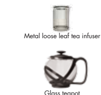
Metal loose leaf tea infuser Glass teapot

Thank you for purchasing the Primula® Glass Teapot. We hope you enjoy the quality craftsmanship of this splendid teapot.