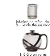
Théière en verre

Merci d'avoir acheté la Théière en verre Primula®. Nous espérons que vous apprécierez l'artisanat de qualité de ce produit magnifique.