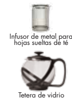
Tetera de vidrio