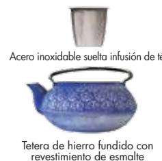
Acero inoxidable suelta infusión de té Tetera de hierro fundido con revestimiento de esmalte

Gracias por comprar la tetera Primula® de hierro fundido, con infusor de té. Esperamos que disfrute la calidad de este espléndido producto.