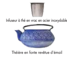
Infuseur à thé en vrac en acier inoxydable Théière en fonte revêtue d'émail

On vous remercie d'avoir acheté cette théière en fonte Primula® avec boule à thé à feuilles mobiles. Nous espérons que vous apprécierez l'artisanat de qualité de ce produit magnifique.